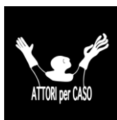
Attori per caso